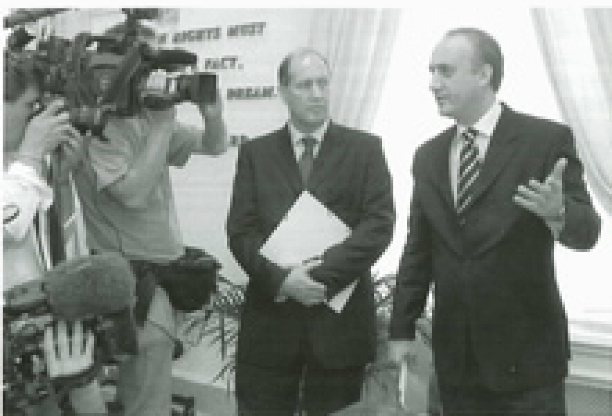
De kerk heeft tientallen jaren al het voortouw getrokken voor mensenrechten en heeft nu recentelijk in Brussel een nieuw Europees Kantoor geopend voor Public Affairs & Human Rights terwille af haar mensenrechtenactiviteiten in Europa te coördineren.