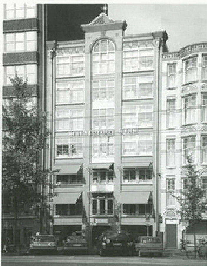
Scientology Kerk Amsterdam, Nieuwezijds Voorburgwal 116-118. Een nieuw onderkomen was nodig door de expansie van de laatste paar jaar. De kerk is het coördinatiepunt voor de vele maatschappelijke activiteiten.

Dit is het geval met de recente verslaggeving over de Scientology Kerk Amsterdam. U heeft zich allicht afgevraagd wat er ten grondslag ligt aan de