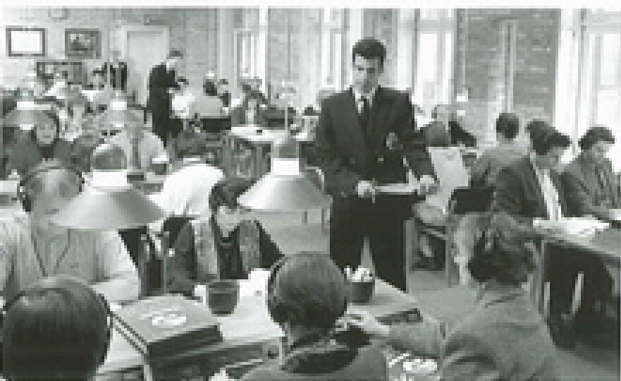
Wat mensen in Scientology doen bestaat voor een belangrijk deel uit het bestuderen van materiaal waarin tot in detail de geestelijke aard van de mensen en de basisprincipes van het leven worden beschreven. Deze studie vindt plaats in een cursusaal van de kerk.

De religie omvat een enorme hoeveelheid kennis. Die kennis komt echter voort uit een aantal fundamentele waarheden,