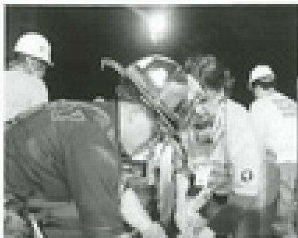
Pastoraal werkers van Scientology werken aan het herstel van geestelijke waarden in de samenleving en helpen mensen op een praktische manier. Honderden pastoraal werkers helpen bij Ground Zero.

iets aan gedaan worden." Deze samen, een onderdeel van een brede publieke informatica-actie, bood hulp aan in vele vormen, zoals die gegeven wordt door de pastoraal werkers.