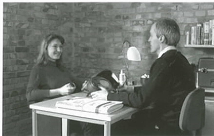
Dit is een auditingssessie — pastorale counseling waar iemand in staat wordt gesteld geestelijke problemen op te lossen en bekwambeden te verborgen.

Daarom werkt de Scientology religie de interesse van mensen uit alle lagen van de samenleving.