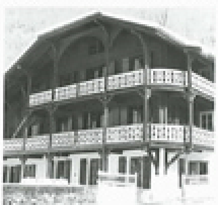
Hierboven: Narconon Arrowhead. Afbeeldingcentrum en tevens het internationale trainingscentrum waar intern ruim 2000 cliënten tegelijkertijd behandeld kunnen worden. Links: iemand die het Narcononprogramma heeft voltooid, samen met zijn dochter en zijn vrouw. Narconon Zwitserland (onder) Narconon Spanje (rechts) maken deel uit van meer dan 70 centra in 30 landen.

"Vrede door mensenrechten". Deze campagne probeert het bewustzijn over en de steun aan mensenrechten te verhogen.